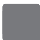
GRIGIO SCURO SATINATO