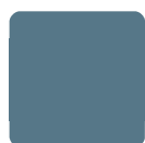
BLU PROFONDO SATINATO